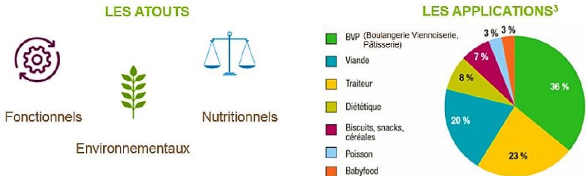
Les atouts et applications des principales sources de MPV

L'essor de ces dernières se traduit par une forte augmentation du nombre de produits alimentaires contenant des protéines végétales (+ 18 % entre 2013 et 2015) 1 et s'explique par une notoriété croissante chez les industriels et une amélioration de la perception des PV par les consommateurs.